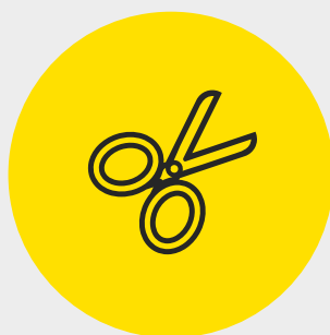
une paire de ciseaux