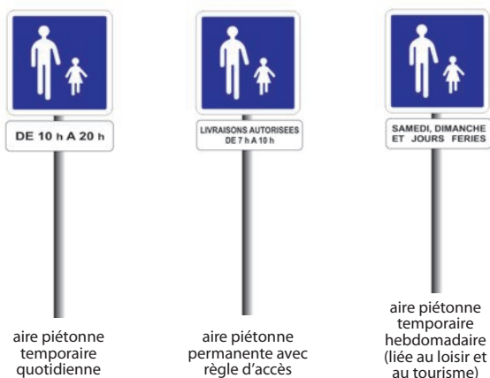
aire piétonne temporaire quotidienne