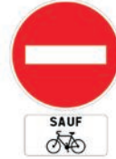
B1 + M9v2

On évitera les panneaux de type C24 qui peuvent donner l'illusion d'une voie réservée au vélo.